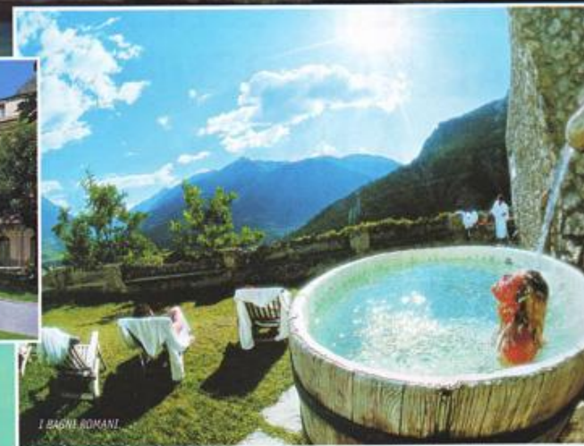
I BAGNI ROMANI