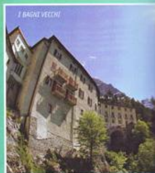
I BAGNI VECCHI

Scendendo ai Bagni Nuovi, i due centri termali distano tra loro pochi minuti, il noir plus ultra è rappresentato dai Giardini di Venere, il parco termale outdoor più grande delle Alpi. Qui si trovano vasche all'aperto da provare anche sotto un'abbondante nevicata: le Vasche di Saturno, le Vasche delle Muse, la Vasca di Aurora, la Vasca di Venere all'aperto, la Fontana di Parche e l'ultima novità, la Vasca delle Naiadi, ampia e alimentata con acqua termale tiepida, ideale per il riequilibrio metabolico dopo la sauna o anche solo per una nuotata.