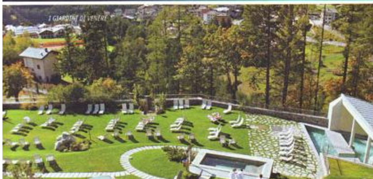
I GIARDINI DI VENERE

Via Milano, 50 - Bormio Tel. 0342.903312 - info@miramontibormio.it www.miramontibormio.it