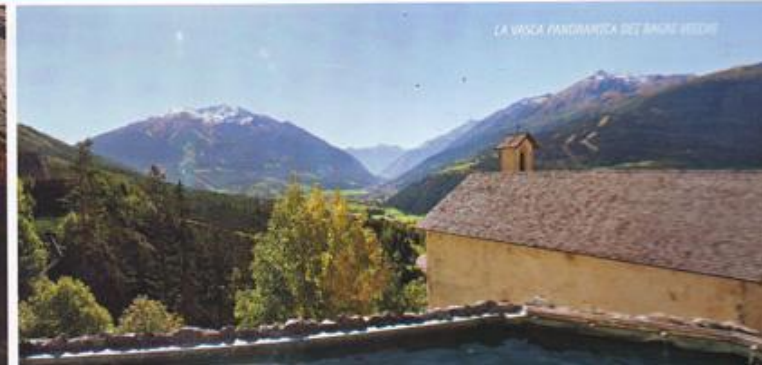
LA VASCA PANORAMICA DEI BAGNI VECCHI